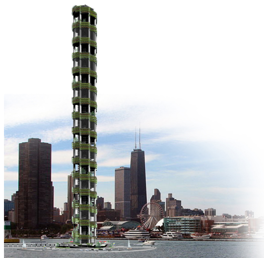
Figur 3 (Aufgabe 5)

Berechnen Sie ferner \vec{s} \times \vec{t} , wobei \vec{s} die Ableitung von \vec{r}(\varphi, t) nach \varphi , und \vec{t} die Ableitung von \vec{r}(\varphi, t) nach t bedeutet, für (c) \vec{r}(\varphi, t) = \begin{pmatrix} t + \cos \varphi \\ t + \sin \varphi \\ t \end{pmatrix} und (d) \vec{r}(\varphi, t) = \begin{pmatrix} R \cos \varphi \cos t \\ R \cos \varphi \sin t \\ R \sin \varphi \end{pmatrix}